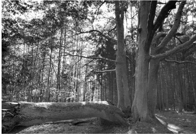
Du šimtamečio Elmės ažuolo kamienai – vienas supuvęs, kitas gyvas – nuvirto audros metu.