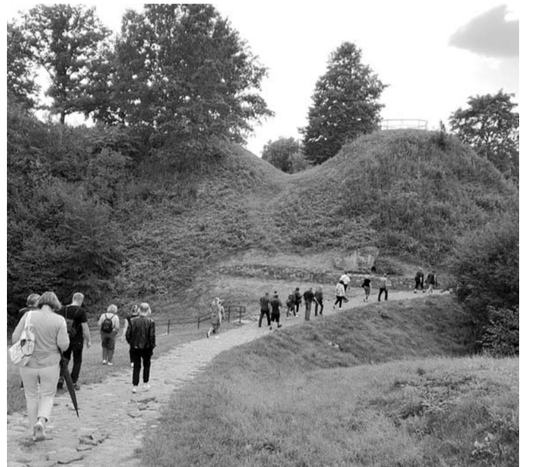
Bendruomenių nariai apžiūrėjo lankytinas vietas Dzūkijoje.