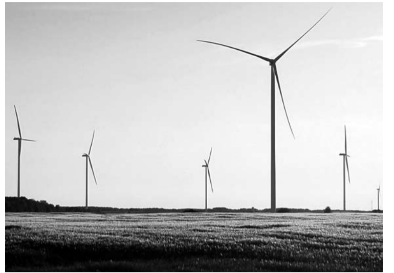
Eksplatuoti naujas vėjo elektrines statytojai tikisi jau kitais metais. Bendra suminė parko galia siektų iki 250 MW.

Vėjo elektrinės gali būti vystomos tik tose teritorijose, kuriose ši veikla yra nedraudžiama. Jų įrengimas negalimas saugomose teritorijose, gyvenamosiose teritorijose, intensyvosios ir ekstensyvosios rekreacijos teritorijose. Taip pat – miestų ir miestelių urbanizuotosios plėtros teritorijose, kurios nustatytos teritorijų planavimo dokumentais, miško paskirties žemėje, teritorijose, kuriose vėjo elektrinių projektavimo ir