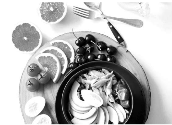
Gydytojos dietologės teigimu, norint maitintis sveikiau, nereikia iškart maisto sverti svarstyklėmis, skaičiuoti kalorijų ar drastiškai kažko atsisakyti – pradėkite nuo savo lėkštės stebėjimo.

Anot gydytojos dietologės, vienas paprasčiausių būdų, kaip kiekvienas gali pradėti pamažu eiti sveikos ir subalansuotos mitybos link – teisingos ir sveikos maisto lėkštės sudarymas. Didžiausią dalį – apie 50–60 proc. lėkštės – turėtų sudaryti gerieji angliavandeniai (vaisiai, daržovės, kruopos). Trečdali lėkštės turėtų būti skirti geriesiems riebalams (kokybiškas aliejus, avokadai, alyvuogės, riebi žuvis, riešutai), o likusią dalį – 10–15 proc. – baltymams (liesa mėsa, ankštinės daržovės, kiaušiniai).