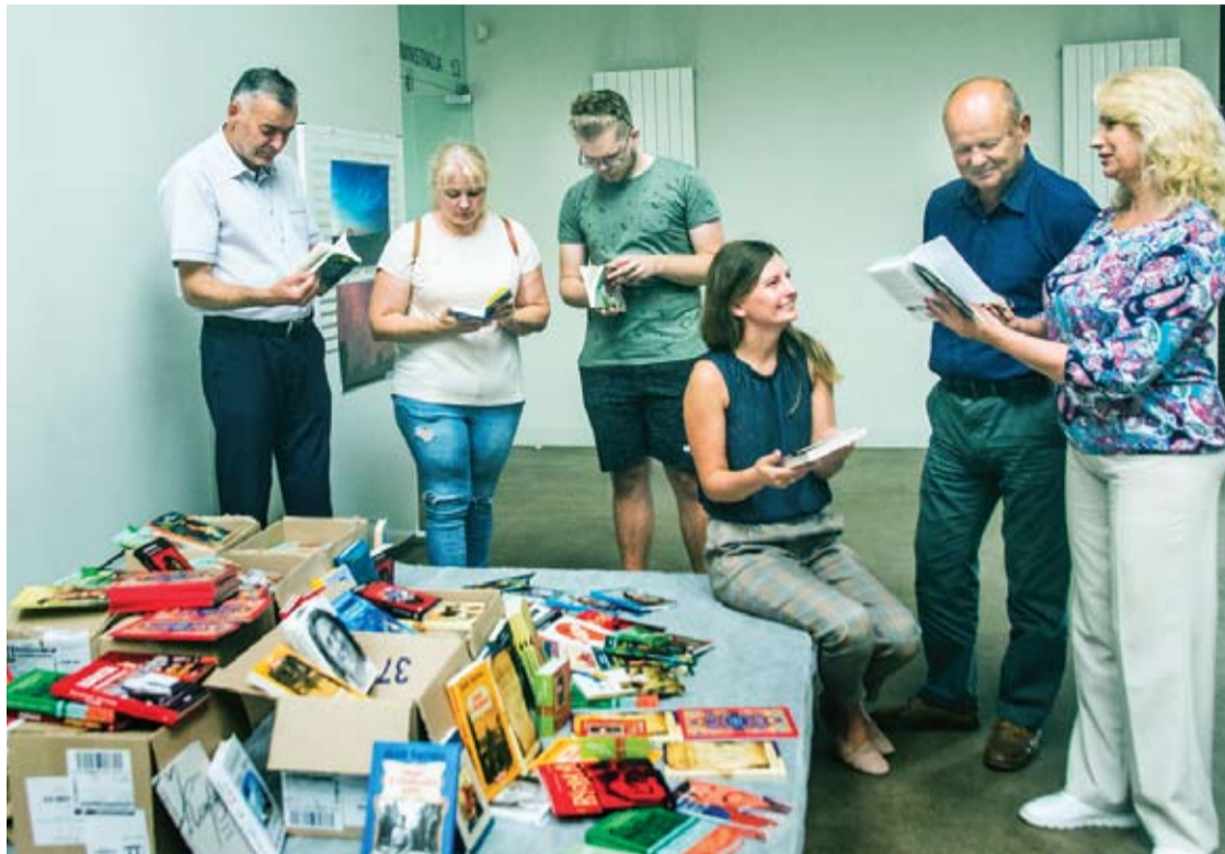
Anykščių bibliotekoje – jau ketvirtoji naujausių ukrainietišku knygų siunta.

Ketvirtadienį, rugpjūčio 31 dieną, Anykščių L. ir S. Didžiulių biblioteką pasiekė beveik 400 knygų iš Ukrainos ukrainiečių kalba. Jos papildė visai Lietuvai kuriamo ukrainiečių knygų centro fondą, kuriame jau yra sukaupta apie tūkstantis knygų.