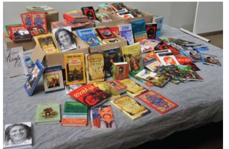
Naujausias ukrainietiškas knygas gali užsisakyti ir skaityti ukrainiečiai iš visos Lietuvos.